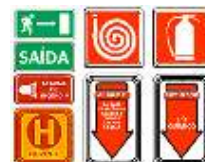
(Exemplo de sinalização)

existir escadas, estas devem possuir corrimão, para que mesmo em caso extremo de não haver luz, a pessoa possa descer ate o térreo acompanhando-a, é claro que todas as luzes de emergência têm que estar ligadas quando se corta a luz do condomínio, mais em caso de fumaça nem sempre é possível ver a sua claridade, por isso o corrimão é tão importante.