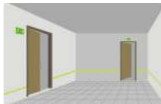
(Exemplo de sinalização de saída de emergência)

Outro item muito importante são as saídas de emergências, elas têm que estar bem sinalizadas e indicar corretamente a rota de fuga, todos no condomínio têm de conhecer estas rotas e como funcionam, em caso de